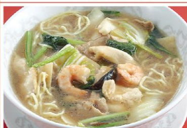
16 五目あん入りラーメン 什景湯麺 800円《醤油・無辛》