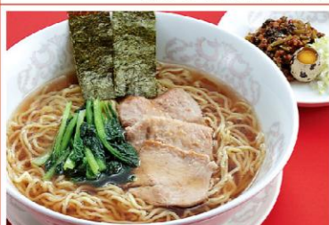
17 パークラーメン 880円《醤油・無辛》