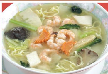
10 海老あん掛けラーメン 蝦仁湯麺 900円《塩・無辛》