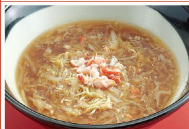
11 蟹入りフカヒレラーメン 蟹肉魚翅湯麺 1,500円《醤油・無辛》