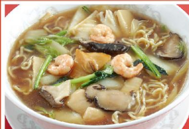
7 熱々魚介三種(海老・赤貝・イカ)入りラーメン 三鮮湯麺 昨年度人気No.2 1,100円《醤油・無辛》