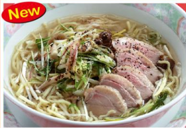
2 合鴨葱入りラーメン 鴨葱湯麺 1,000円《塩・無辛》