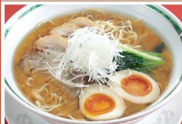
9 柔らかポーク胡麻味噌ラーメン 醤油湯麺 1,000円《味噌・無辛》