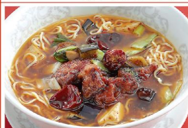
15 鶏唐ピリ辛ラーメン 辣椒鶏塊湯麺 1,000円《醤油・強辛》