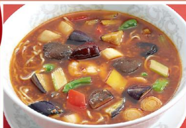
8 海老と挽肉の辛いラーメン 麻辣蝦仁湯麺 昨年度人気No.3 900円《醤油・強辛》