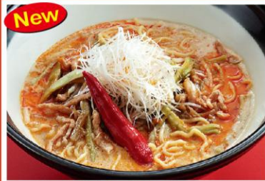
1 肉野菜タンタンメン 迷你担々麺 800円《味噌・中辛》