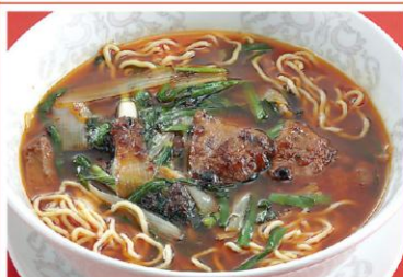
14 レバニラ入りラーメン 韭菜猪肝湯麺 950円《醤油・中辛》