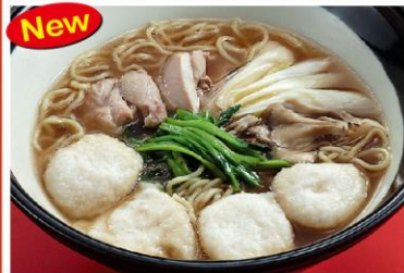
5 山芋・鶏肉入りラーメン 山芋湯麺 1,000円《醤油・無辛》