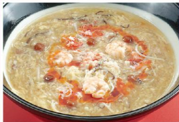
6 魚介入り酢辛麺 酸辣湯麺 昨年度人気No.1 880円《醤油・中辛》

2012 1月7日(土) ⇒ 2月29日(水) AM 11:30 ~ PM 9:00 (ラストオーダー PM 8:30) ※表示価格は税込です。 ら~めんフェア スタンプカード ラーメン1杯お召し上がりにつきスタンプを1個押印します。 ◎スタンプ10個でホテル特製食べるラー油1個進呈。 ◎スタンプ18個でお好きなラーメン1杯無料サービス。 ※スタンプカードは1Fフロントおよびレストランニューパークにて配布しています。