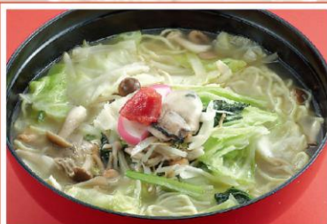
13 チャンポンメン ※麺は「きわうち麺」or「中華麺」の中からお選び下さい。 1,050円《塩・無辛》