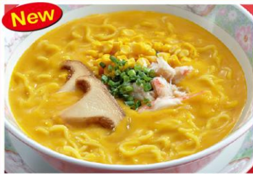
4 パンプキンスープラーメン 南瓜湯麺 900円《塩・無辛》