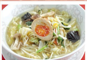
12 野菜たっぷり塩味ラーメン 蔬菜湯麺 (ローズソルト使用) 880円《塩・無辛》