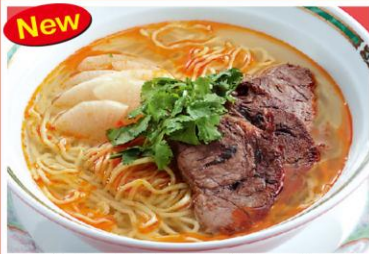
3 牛肉・牛骨スープラーメン 牛肉湯麺 980円《塩・中辛》